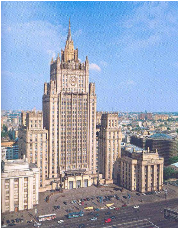
外交部办公大楼——典型的斯大林式建筑

的削弱。这主要体现在试图“绕过联合国安理会，通过采取单方面制裁和武力行动的方式来解决危机”、“肆意曲解联合国决议”以及“推行以颠覆合法政权为目的的理念”。四是跨境威胁和挑战日益扩大。这里首次将“来自信息空间的威胁”列为重要威胁之一。五是“（西方国家）重新注重国际关系中意识形态问题的倾向”。