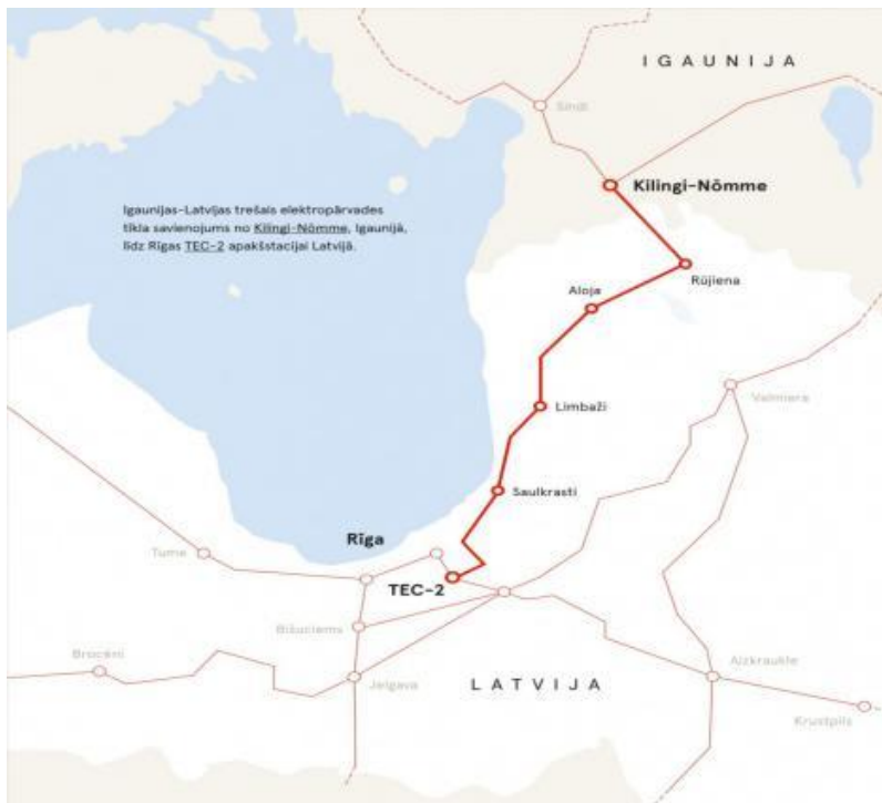
第三条拉脱维亚-爱沙尼亚330伏高压输变电线路

拉脱维亚国家电网已在北欧电力交易所（Nord Pool Spot）上市。中资企业来拉脱维亚投资设厂不需要自备发电设备。