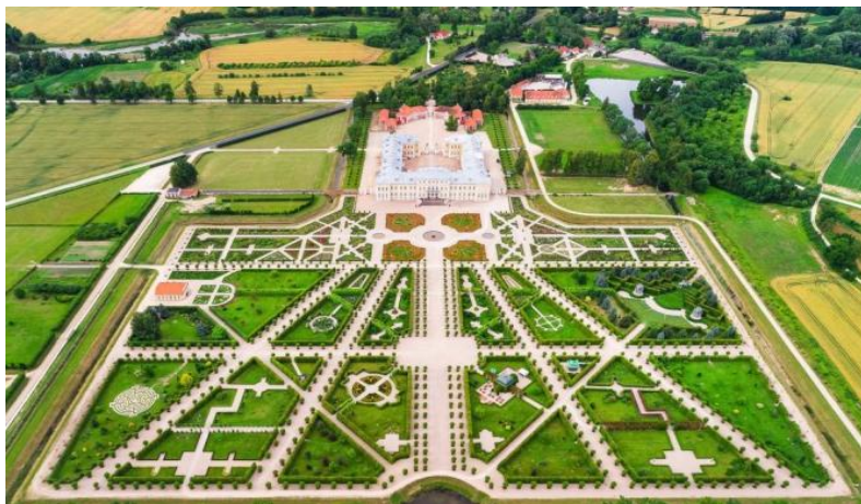
创建于18世纪的隆达列宫是拉脱维亚最知名的旅游景点之一