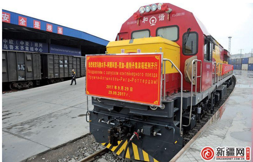
驶向波罗的海的中欧班列

2016年11月，第一列中欧班列(义乌—里加)抵达里加。2017年5月，从里加始发、经哈萨克斯坦到中国喀什的首趟铁路货运班列开行。2017年10月，中欧班列(乌鲁木齐—里加—鹿特丹)抵达里加，开辟了中欧班列“东联西出”铁海联运新通道。2018年，武汉-里加、西安-里加中欧班列抵达里加。