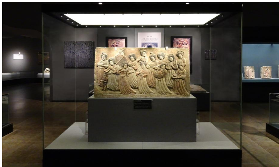
Groglass产品应用于河北省博物馆

(5) 拉脱维亚黑药酒公司 (Latvijas balzams)，成立于1900年，现属于琥珀饮料控股集团，是波罗的海地区最大的酒精饮料生产商，旗下130多种品牌产品出口至全球170多个市场，名牌产品为里加黑药酒 (Riga Black Balsam)，由多种传统草药加入纯伏特加制作而成。