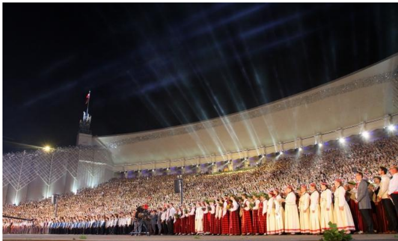
每4年举办的拉脱维亚合唱和歌舞节