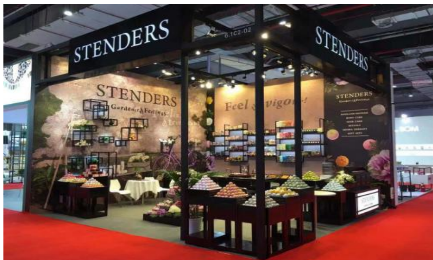
首届进博会期间STENDERS施丹兰展台形象

(4) 格林戴克斯 (Grindex) 制药集团：是波罗的海三国制药行业的龙头企业，经营范围包括药品研发、生产、销售等，2015年9月就催产素注射剂供应与世界卫生组织 (WHO) 签署长期合作协议。集团产品已出口到87个国家和地区，在拉脱维亚、爱沙尼亚、斯洛伐克有4家子公司，在11个国家 (地区) 设有代表处。2020年，该集团营业额达1.87亿欧元，同比增长32%；利润为1900万欧元，同比增加4%。