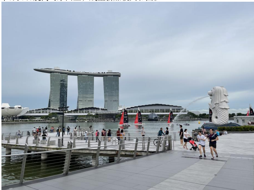
新加坡鱼尾狮公园

新加坡古称淡马锡。8世纪属室利佛逝王朝，18-19世纪是马来柔佛王国的一部分。1819年英国人史丹福·莱弗士抵达新加坡，与柔佛苏丹签约，开始在新加坡设立贸易站。1824年新加坡沦为英国殖民地，成为英国在远东的转口贸易商埠和东南亚的主要军事基地。1942年被日本占领。1945年日本投降后，英国恢复殖民统治，次年划为其直属殖民地。1959年实现自治，成为自治邦，英国保留国防、外交、修改宪法、宣布紧急状态等权力。1963年9月16日与马来亚、沙巴、沙捞越共同组成马来西亚联邦。1965年8月9日脱离马来西亚，成立新加坡共和国。