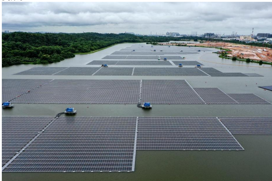
中国能源建设集团山西公司承建登加蓄水池水上光伏项目

体施工工作已完成，全面进入系统调试阶段，预计于6月并网发电。本项目是目前世界最大的淡水水库浮体光伏项目之一，也是新加坡首个大型光伏电站，项目将为新加坡2025年光伏发电达到1.5GW峰值的目标做出积极贡献。