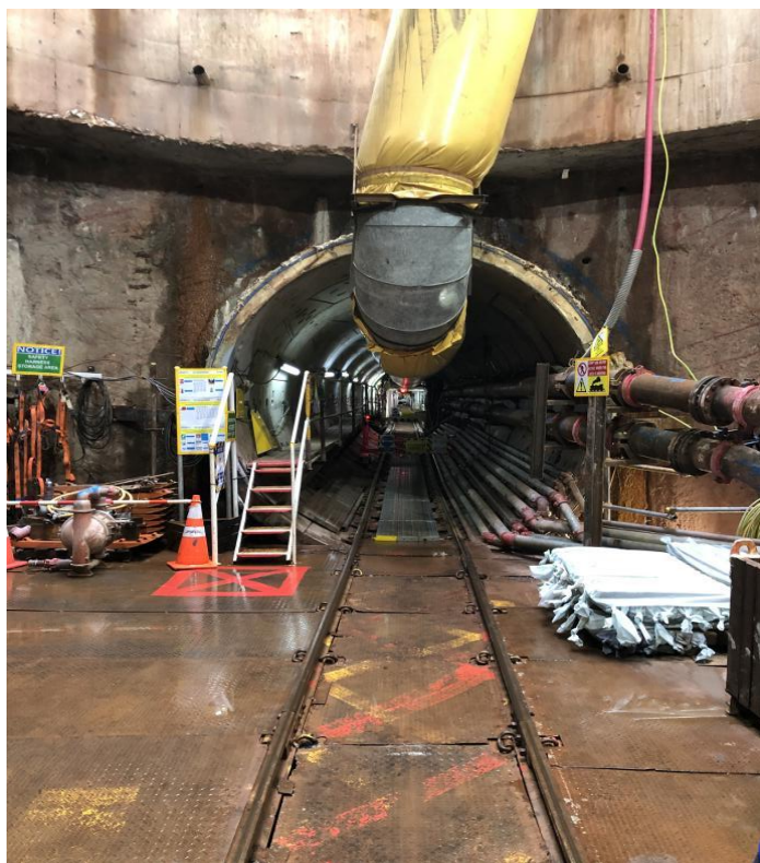
上海隧道在建项目