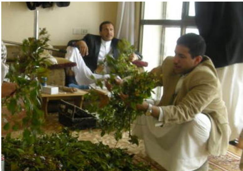
也门人日常生活中的“卡特”聚会