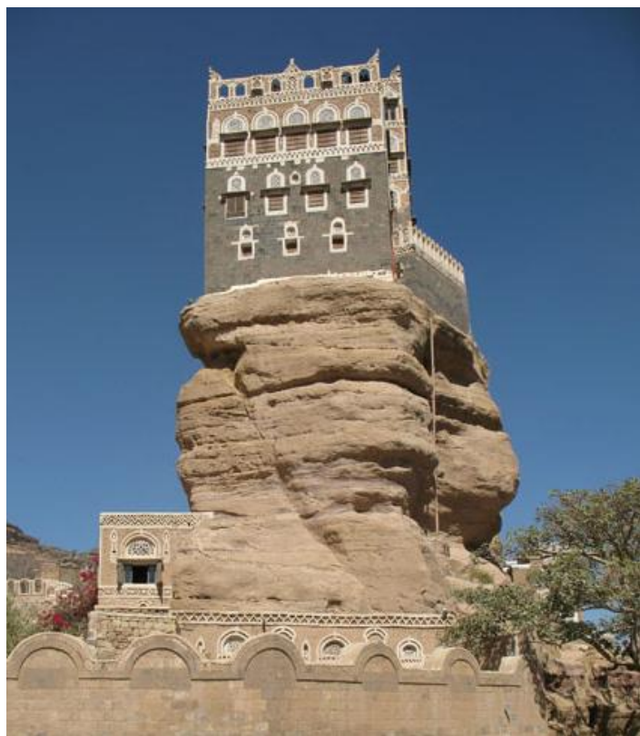
叶海亚王宫（又称石头宫）

也门是阿拉伯半岛人口最多的国家，世界银行数据显示，截至2019年底，也门人口约2916.2万人，增长率为2.3%；城市人口和农村人口分别占总人口的36.64%和63.36%；城市人口和农村人口增长率分别为4.1%和1.37%。2019年，首都萨那人口287.4万人，占也门城市人口的26.4%。除首都萨那外，人口集中的省份还有亚丁、塔兹、荷台达和伊卜。