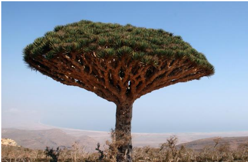
索科特拉岛特有树种——龙血树

也门有悠久的古代文明、丰富的文化遗产和杰出的建筑作品。据联合国教科文组织统计，也门有索科特拉岛等四处古迹或景区被列为世界文化遗产。“四五”规划将旅游业对GDP的贡献率从3.5%上调到4.75%，目标是吸引更多海湾国家的游客。政府将投入540万美元用于解决安全方面的问题。