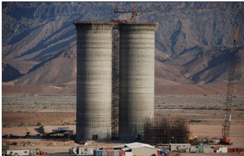
中材国际工程股份有限公司承建也门穆卡拉AYCC水泥厂项目

【承包工程】据中国商务部统计，2019年中国企业在也门新签承包工程合同7份，新签合同额856.99万美元，完成营业额1043.17万美元。累计派出各类劳务人员0人，年末在也门劳务人员21人。新签大型承包工程项目包括华为技术有限公司承建也门电信项目。