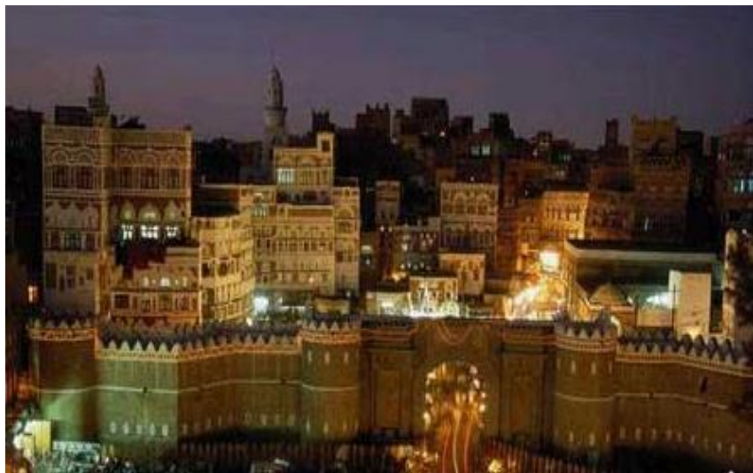
萨那老城（又称也门门）

也门水资源紧缺，主要依靠地下水。近年来，一些地方由于过度开采地下水，水资源紧张的趋势进一步加剧。