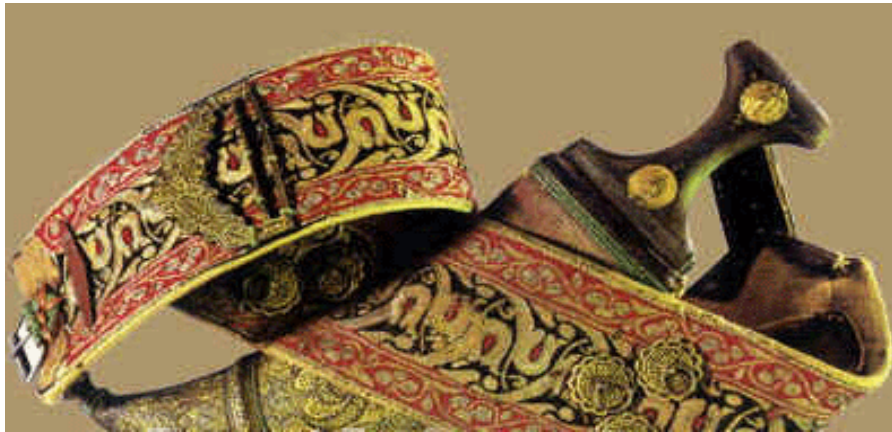
精美的也门传统服饰和腰刀

也门妇女在家可以穿着很艳丽的服装，但是外出时身披黑色长袍，带黑色头巾，大多带黑色面纱，身上戴有手镯、项链、耳环等首饰，有的还在手、脚和脸上画着姜黄色的各种图案，作为装饰。随着现代意识的不断引入，也有一部分受高等教育并工作的也门妇女只包头，不再戴面纱。