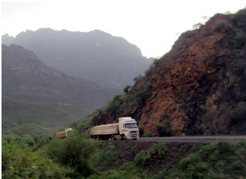
中国援建的荷台达-萨那公路

达了习近平主席的亲切问候和良好祝愿，表示中方坚定支持也门的主权、独立、统一和领土完整，支持也门政治过渡和经济重建进程，期待也门早日恢复和平稳定，共同推进“一带一路”建设，实现合作共赢。2016年3月，田琦大使在利雅得会见也门副总理兼外长艾勒马赫拉斐，表示中方希望也门早日恢复和平与稳定，与也方共同推进“一带一路”建设，共同为深化中阿全面合作、共同发展战略合作关系做贡献。2016年4月，中国中东问题特使宫小生表示，中方政府支持通过政治谈判解决也门问题，支持联合国秘书长也门问题特使的斡旋努力，对也门各方拟于近期举行新一轮和谈表示欢迎。2016年5月，外交部长王毅在多哈出席中阿合作论坛第七届部长级会议前会见也门副总理兼外长马赫拉斐。2016年11月11日，中国中东问题特使宫小生会见来华访问的联合国秘书长也门问题特使艾哈迈德，就也门问题深入交换了看法。2017年9月7日，驻也门大使田琦在利雅得会见也门总统哈迪，强调中方支持政治解决也门问题，支持联合国及联合国秘书长也门问题特使的斡旋努力，希望也门尽快恢复和平，中方愿积极参与也门未来战后经济重建，与也方携手推进“一带一路”建设，造福两国人民。2018年7月11日，国务委员兼外交部长王毅在北京同来华出席中国-阿拉伯国家合作论坛第八届部长级会议的也门外交部长耶曼尼举行会谈。