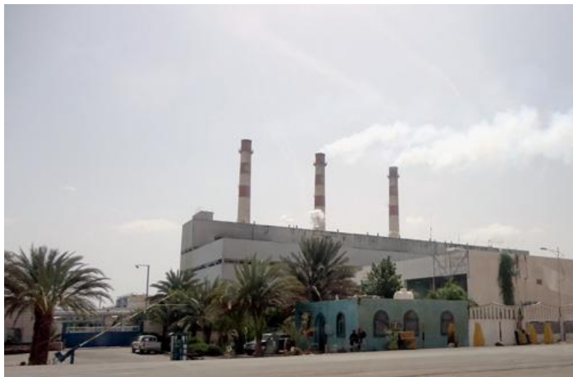
亚丁自由区发电厂