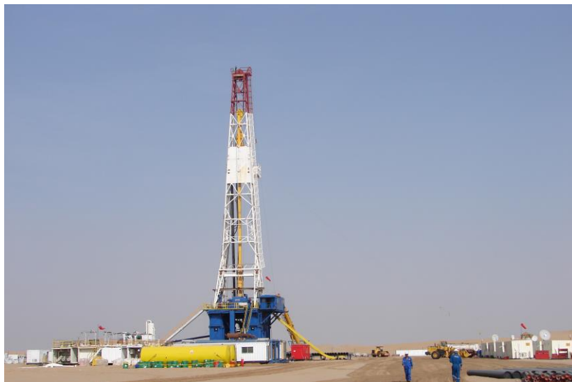
中石化国勘也门分公司投资的ABYE-1号钻探井

【承包工程】据中国商务部统计，2019年中国企业在也门新签承包工程合同7份，新签合同额856.99万美元，完成营业额1043.17万美元。累计派出各类劳务人员0人，年末在也门劳务人员21人。新签大型承包工程项目包括华为技术有限公司承建也门电信项目。