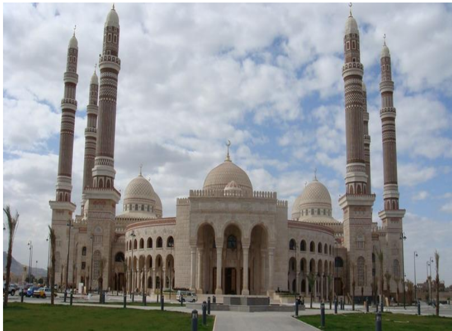
雄伟壮丽的萨利赫总统清真寺

伊斯兰教众每天5次祈祷，由教长通过高音喇叭“唤礼”，颂诵“古兰经”，表示虔诚。教众对公历星期五（回历礼拜天）的礼拜活动非常重视，不论男女老少都前往附近的清真寺跪拜祷告。也门作为正统的穆斯林国家，禁止销售和饮用各类酒，不吃猪肉，禁止对也门女人拍照。